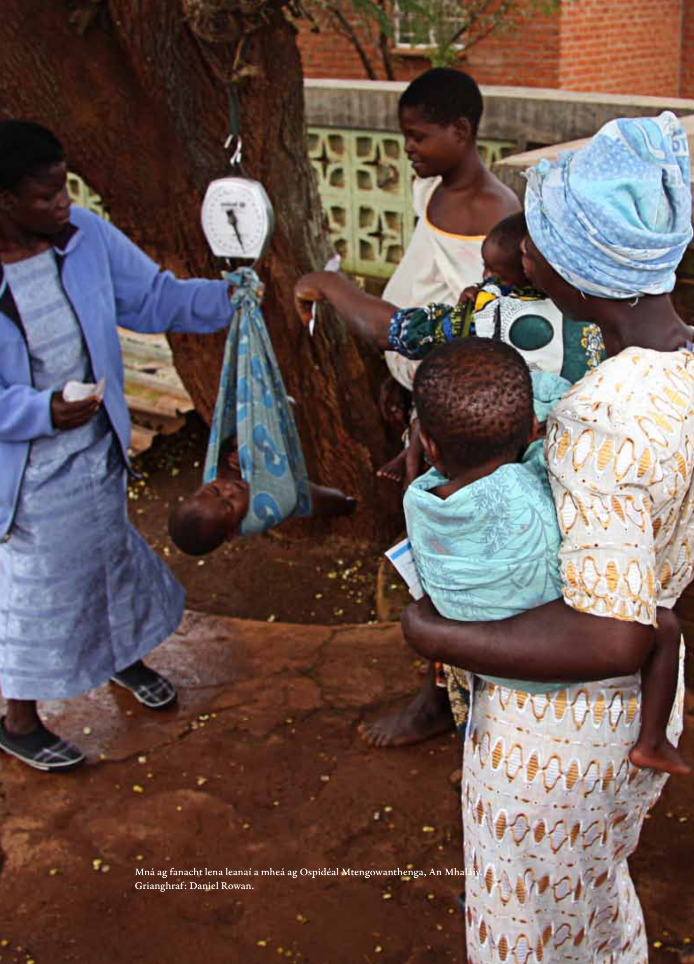
Mná ag fanacht lena leanaí a mheá ag Ospidéal Mtengowanthenga, An Mhaláiy.