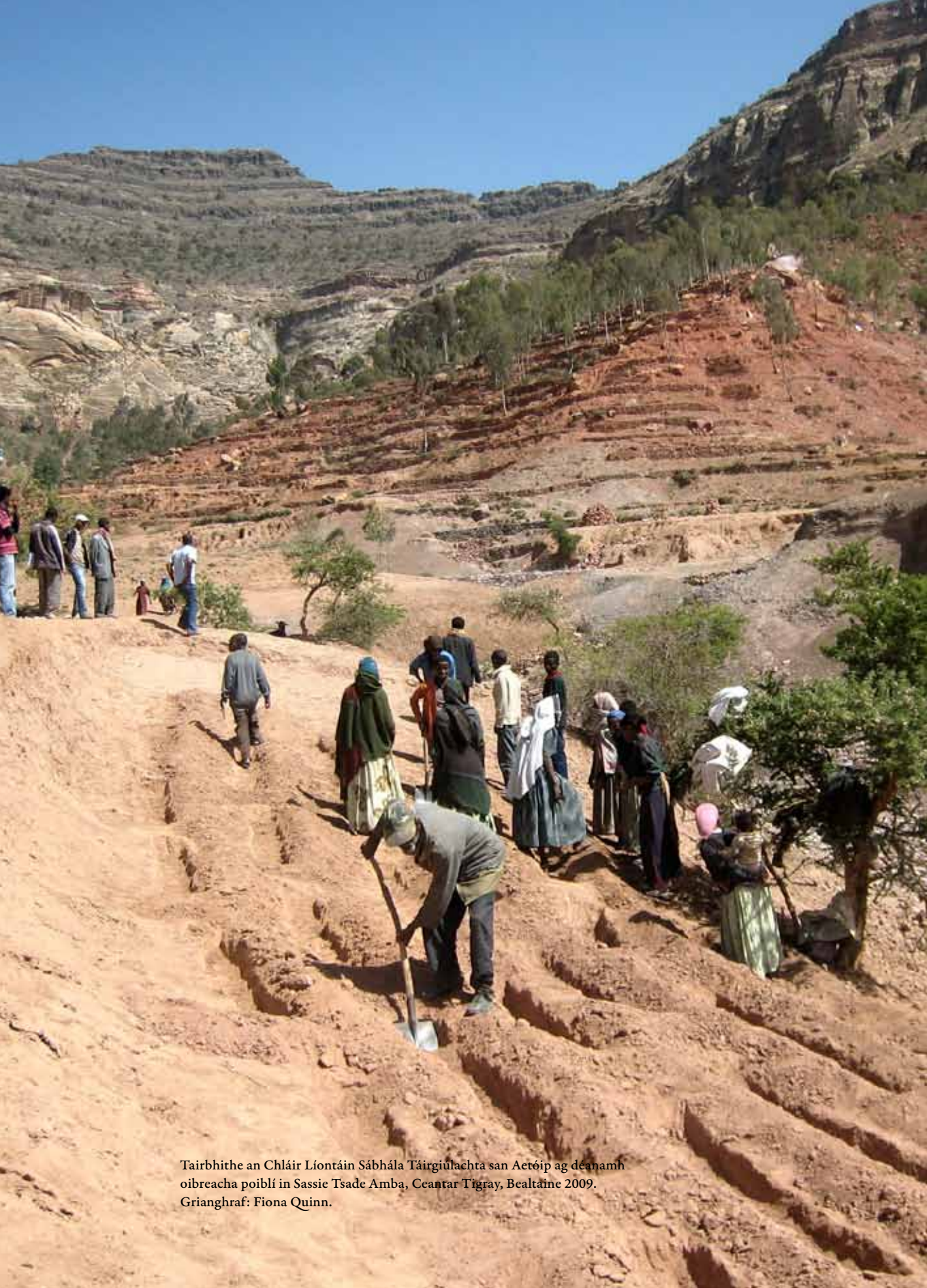
Tairbhíthe an Chláir Líontáin Sábhála Táirgiúlachta san Aetóip ag déanamh oibreacha poiblí in Sassie Tsade Amba, Ceantar Tigray, Bealtaine 2009.